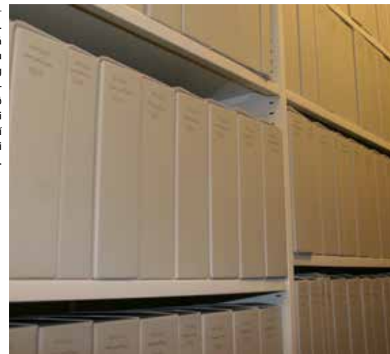
Í einni af skjalageymslum safnsins. KLUG öskjur frá Þýskalandi eru núna notaðar og mikil vinna framundan við að umpakka eldri afhendingum í viðeigandi umbúðir.

Eins og áður eru stærstu afhendingarnar frá skilaskyldum aðilum – um helmingur af fjölda afhendinga, en ef horft er til fjölda hillumetra þá er hlutfallið yfir 90% af samanlögðum hillumetraffjölda. Meginreglan er sú að starfsmenn héraðsskjalasafnsins aðstoða skilaskylda aðila með margvíslegum hætti skv. nánara samkomulagi hverju sinni. Í mörgum tilfellum ná starfsmenn skjalasafnsins í skjölin, skrá, flokka og ganga frá þeim í geymslur. Þessa vinnu greiða sveitarfélögin sérstaklega fyrir. Þetta fyrirkomulag styrkir sambandið á milli sveitarfélaganna og skjalasafnsins og mun nýtast enn betur í framtíðinni þegar skjalasafnið fer að sinna lögbundnu eftirliti.